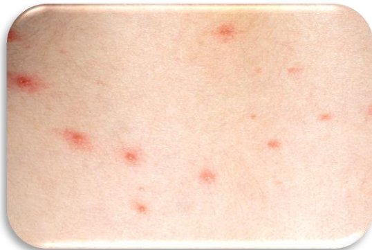
Вітряна віспа починається з червоного висипу.