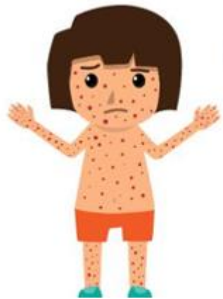
Висип, що свербить

Симптоми вітрянки (вітряної віспи) включають: